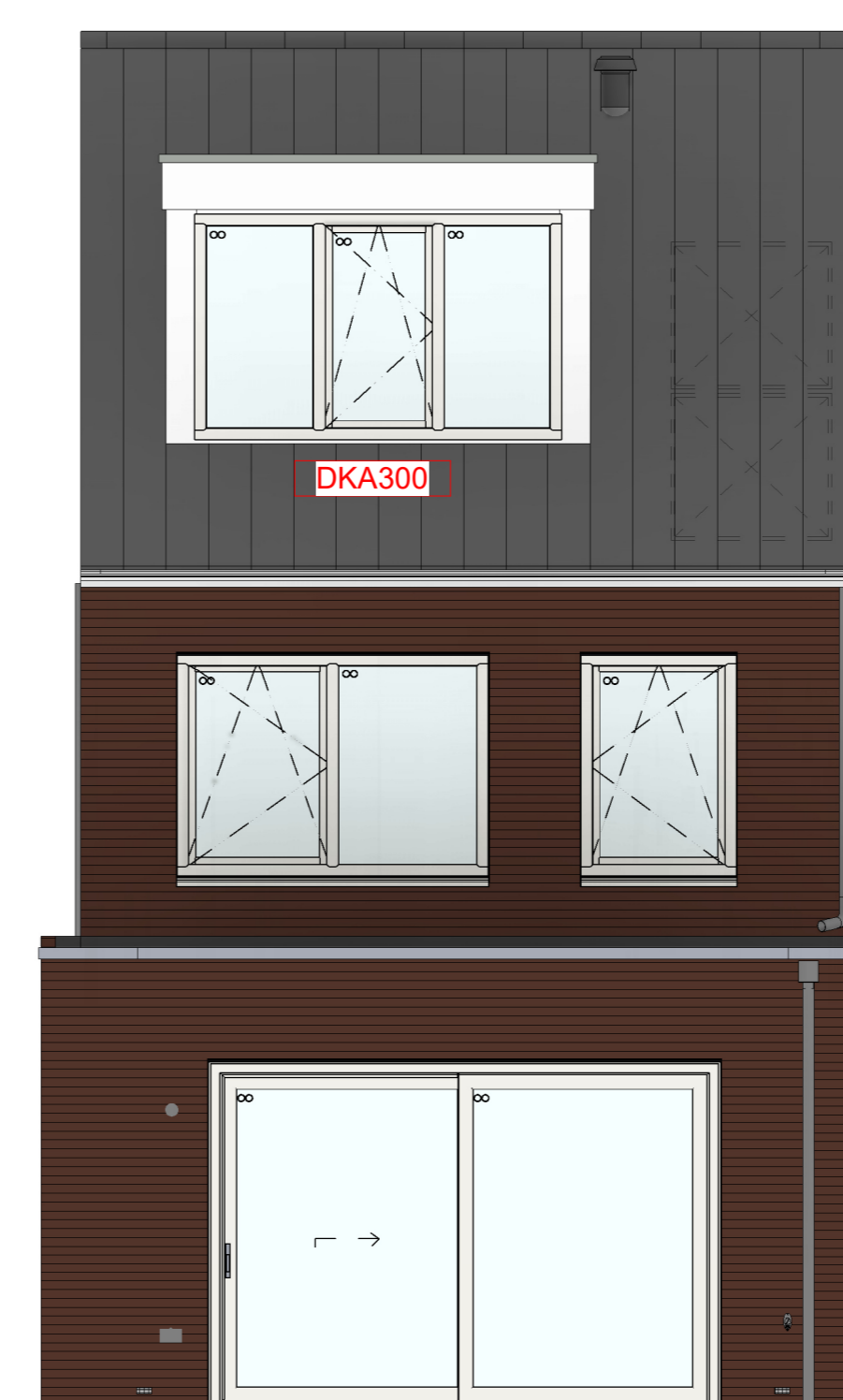
AG5001 - Achtergevel in basis uitvoering