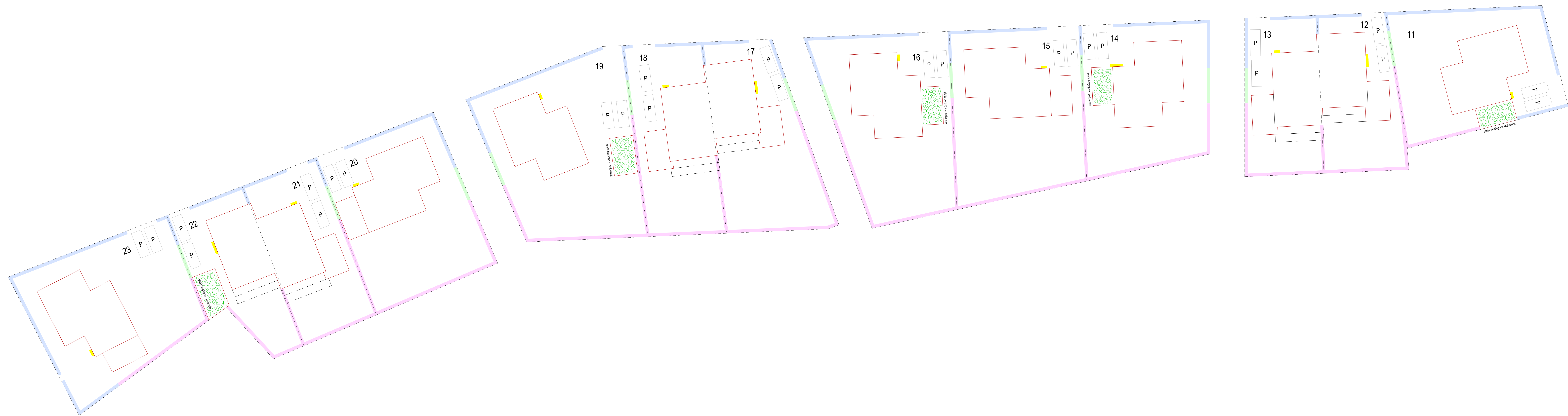
Situatie 1 : 200